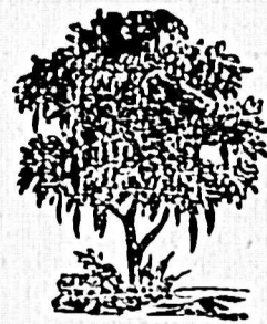
VINO DE MÁLAGA QUINA ENCARNADA, KAROUBA

Depósito general en París, farmacia de BOULLAY, individuo de la Academia imperial de Medicina, oficial de la Legion de Honor y en todas las boticas de Francia y del extranjero.