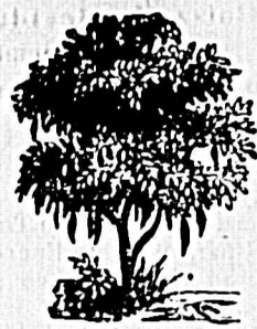
VINO DE MÁLAGA QUINA ENCARNADA, KAROUBA

Regeneración completa de la sangre empobrecida, de los temperamentos débiles y linfáticos y de la cantidad añeja.