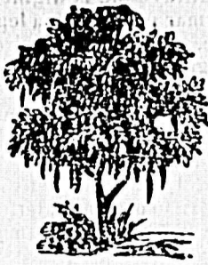
VINO DE MÁLAGA QUINA ENCARNADA, KAROUBA