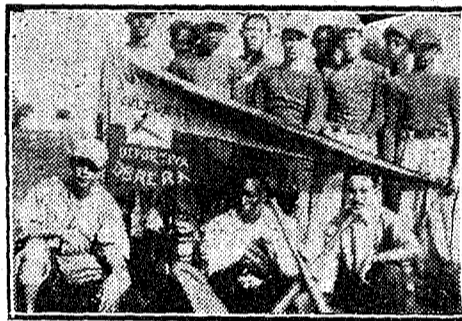
Team de football de la Juventud Cultural y Deportiva Obrera de Cuba

El hecho de estar "estrictamente prohibido tratar cues-