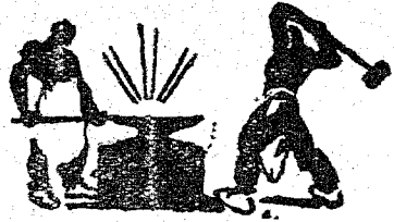
Momento del Congreso

Según estaba anunciado rodeado de las más amplias simpatías y esperanzas del proletariado mundial, al mismo tiempo que mirado con el más profundo odio por parte de la burguesía y de los gobiernos capitalistas de la tierra, se ha realizado, recientemente, el V Congreso de la Internacional Sindical Roja.