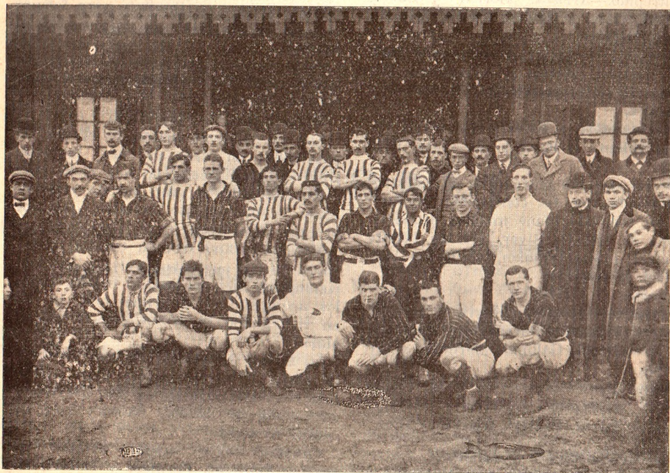
Team Belgrano-River Plate

ro; Pedragosa se desempeñó con corrección, Espinosa presentose de nuevo en el cuadro como en sus mejores días.