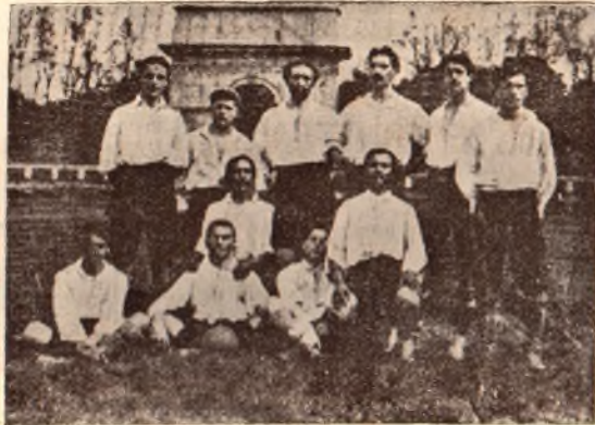
El primer equipo de «Pro Vercelli» Campeón de fútbol italiano en la última temporada

Nacional jugará hoy en el Parque con French los minutos que faltaron para finalizar su anterior partido.