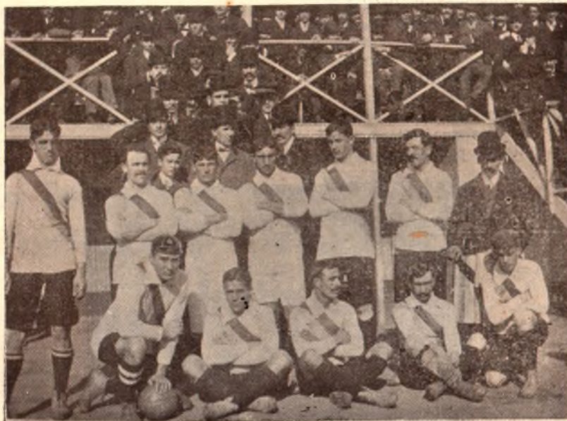
Copa Lipton — El cuadro uruguayo en 1907

Una vez terminado el campeonato en el Casino argentino—en el que se disputarán cinco premios, el primero de 20.000 francos, de 8.000 el segundo, y de 3.000,