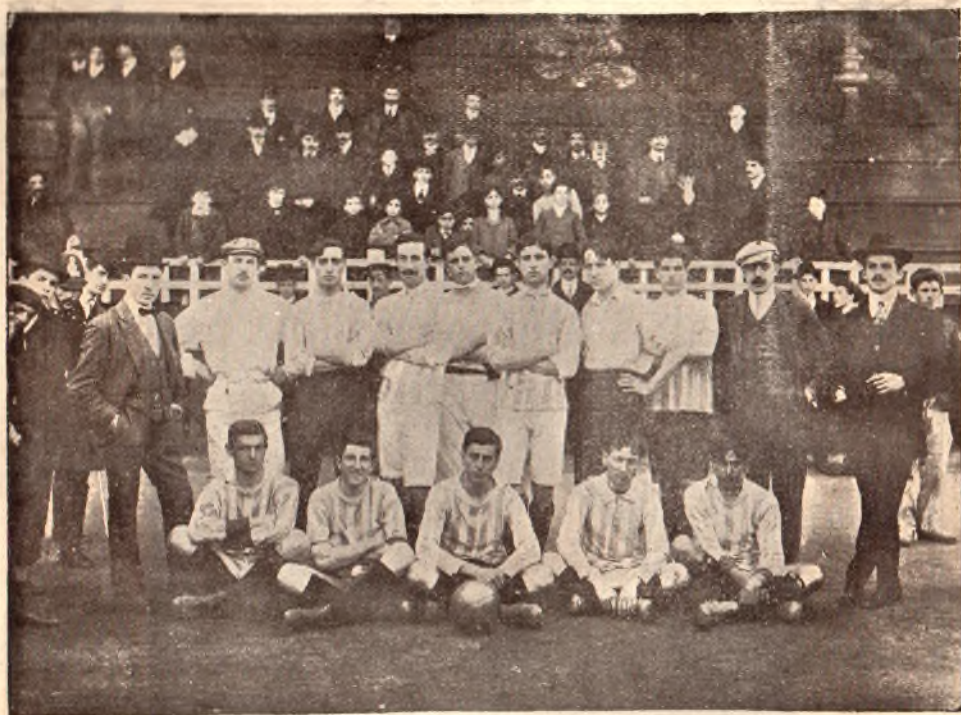
Centro Atlético Montevideo — Su primer team

Cocky; Fernández y Bastos; Altamirano, Allende y Azarola; Strauch, Barríola, Casaravilla, Sierra y González.