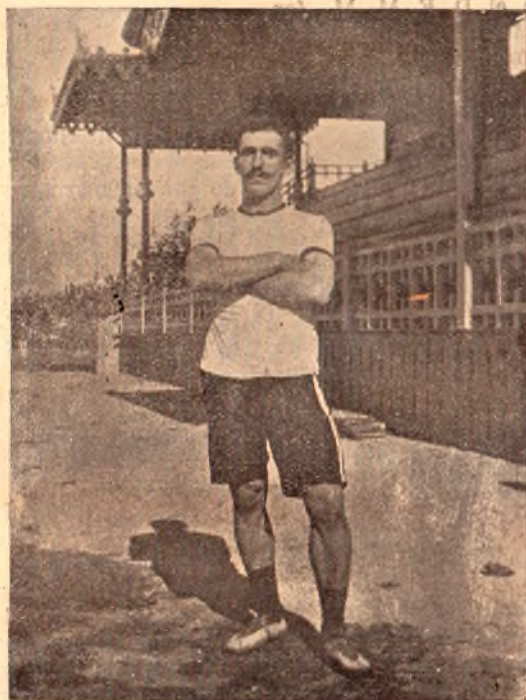
Narciso Cerato, campeón del salto á la garrocha

entre nosotros por sus sobresalientes dotes de atleta, y sus triunfos en los juegos olímpicos le colocaron entre los mejores de la América del Sud.