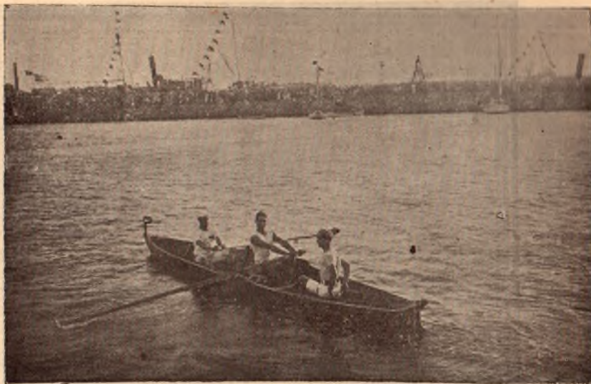
Giggs. - Ganador de la Internacional de los juegos olímpicos