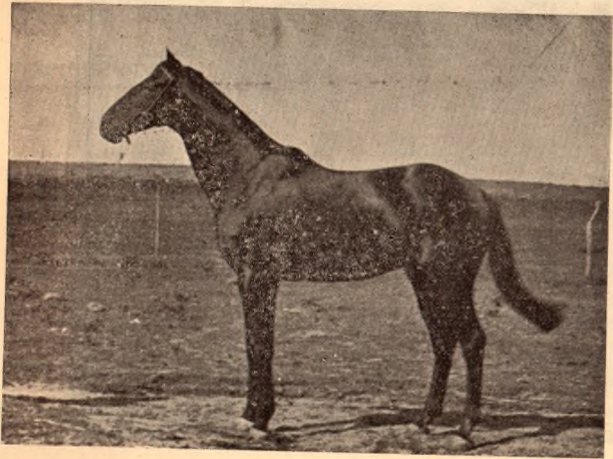
SALTO Padrillo del Haras «Los Pinos»

Después de su última performance, Lionell se destaca en la carrera para productos de tres años no ganadores.