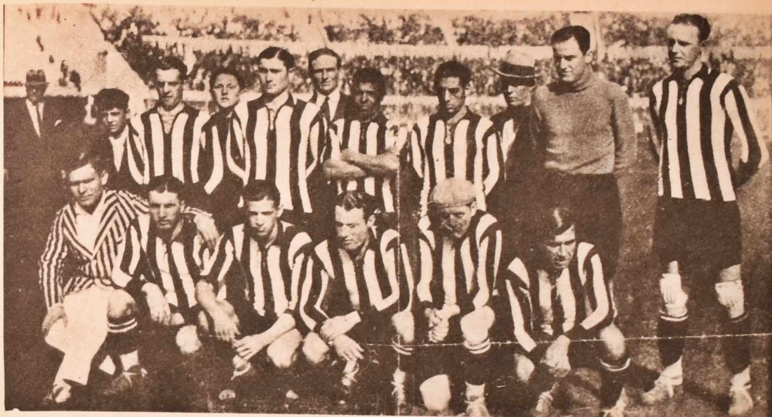
Wanderers, Campeón Uruguayo de 1931, en los umbrales de la profesionalización. Con Nacional y Peñarol, los bohemios es uno de los tres clubes sobrevivientes del "fútbol heroico". Esta es su formidable alineación al año siguiente del Mundial. Díaz, Del Bono, Lobos, Ochluzzi, Ceriani, Tejera, Frioni, Rodríguez, Rapetti, Conti y Ferradans.

un lustro a los dos primeros para la Copa Libertadores de América. La vibración en el torneo local aparece empujada por el brillo de aquel campeonato (y otros) que hace trascender nuestros equipos (grandes) en el extranjero.