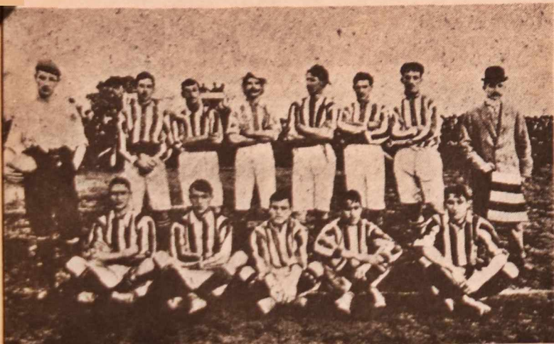
El Wanderers de 1906, brillante campeón de la temporada. En la primera década del siglo fue el club que más jugadores dio a la selección.

El CURCC de Villa Peñarol ganó el campeonato —invicto— rivalizando sólo con Albion. Los otros equipos carecían de fuerza deportiva. (2)