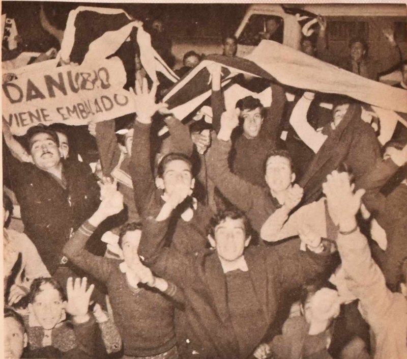
Danubio es el más joven de los clubes de primera línea: nació como equipo de niños y creció con ellos. Fue subcampeón Uruguayo en 1954.

NACIONAL: Ares, L.; Bértola, J.; Capuccio, A.; Demarchi, S.; Foglino, F.; Formento, F.; Marán, R.; Olivieri, P.; Pesquera, R.; Porte, A.; Romano, A.