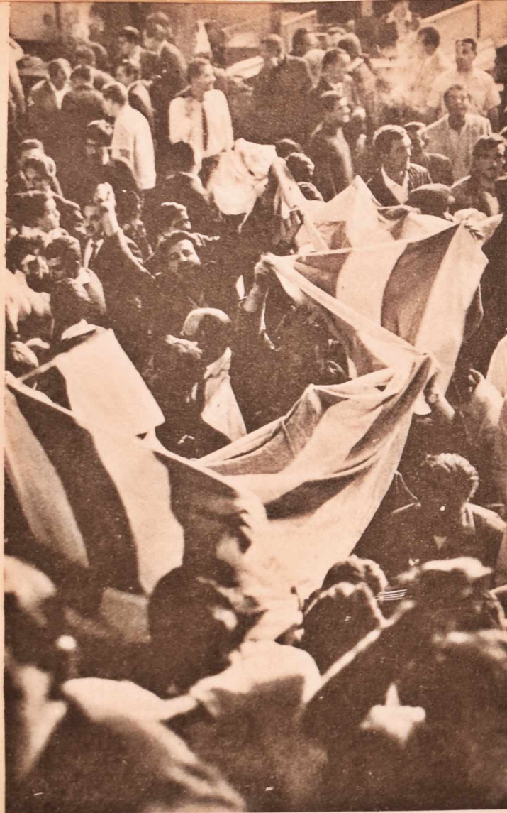
La actuación de Cerro ambientó una euforia hasta entonces desconocida detrás de un club "chico".