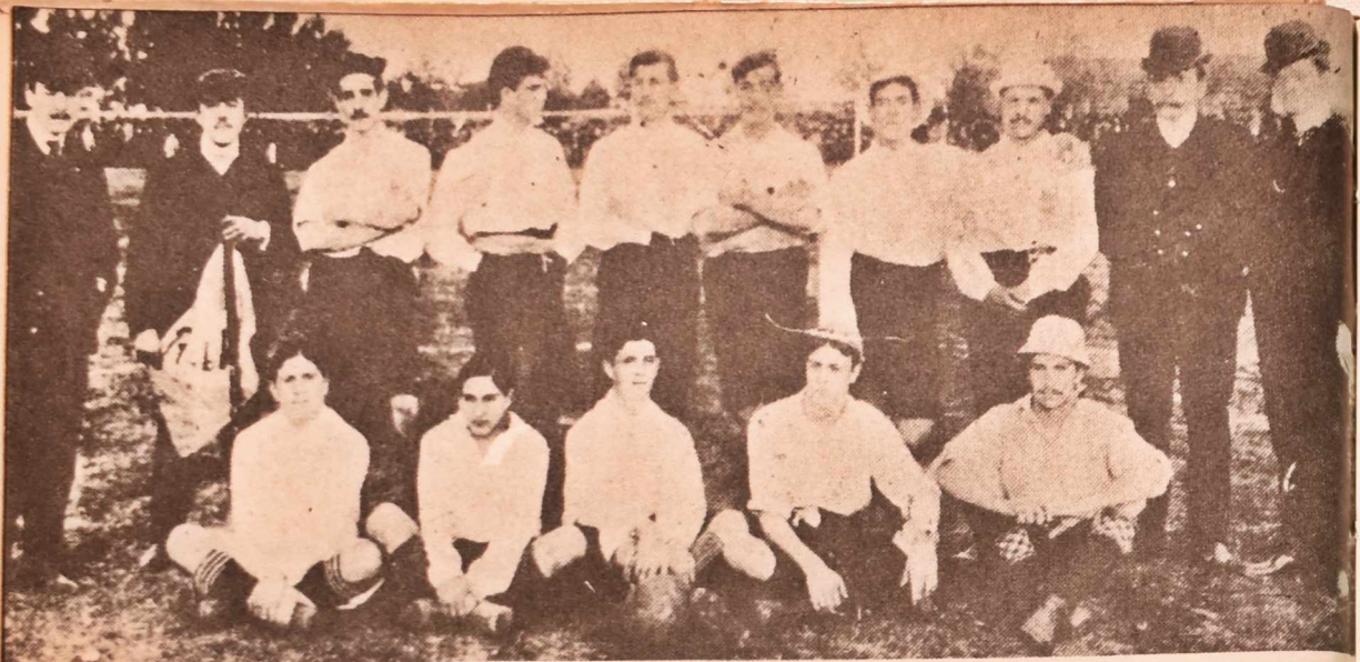
El Club Nacional ganó el torneo en 1902 y 1903, afianzando la poderosa corriente que representaba. Este es el equipo del año 03, el mismo que obtuviera el primer y brillante galardón para el fútbol del país en Buenos Aires, el histórico 13 de setiembre.

rioso team del siglo viejo, aporte fundamental para el crecimiento de la primera área deportiva criolla: Punta Carretas. Al grito de "Come on, Albions...", el maestro Poole no sólo había desarrollado la técnica sino el amor propio de los jugadores del tiempo heroico. Había pasado ya una década feliz y exitosa, incluso a nivel rioplatense, y la Copa Uruguaya encontró al Albion en el final de su gran ciclo. Trasladado al Paso Molino, no tuvo la virtud de renovar su equipo y —lo peor— de dar