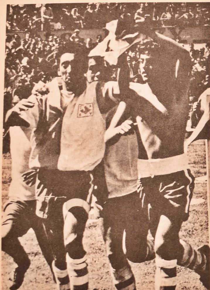
Después de un largo "destierrro" en la División B, en 1969 retornó Bella Vista, el club del inmortal Nasazzi.