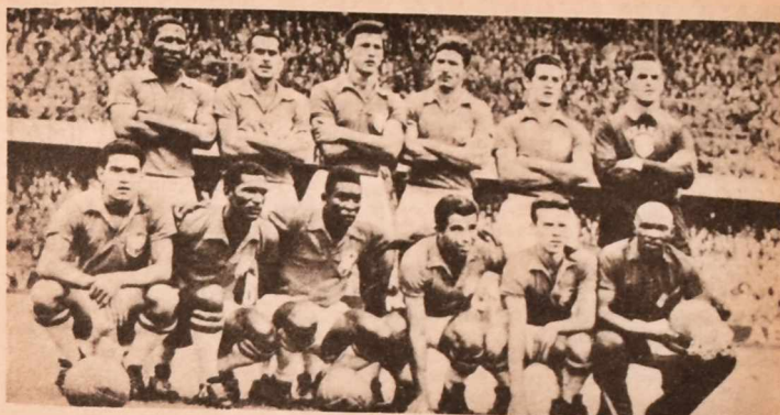
Brasil 1958. Un equipo espectacular, que lanzó a dos de los mejores atacantes que ha producido el fútbol: Garrincha y Pelé. Un juego joven y novedoso con una tremenda imaginación ofensiva.

Goles: Rahn (2) y Morlock (A); Puskas y Czibor (H).