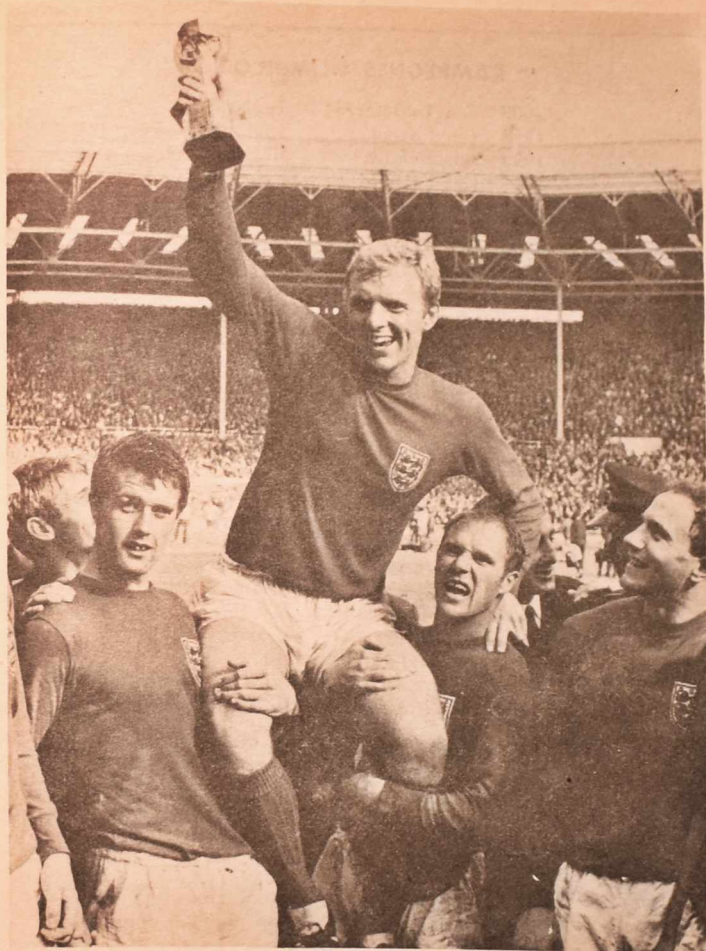
Bobby Moore, capitán inglés, levanta en triunfo la Copa del Mundo, en Londres, 1966.