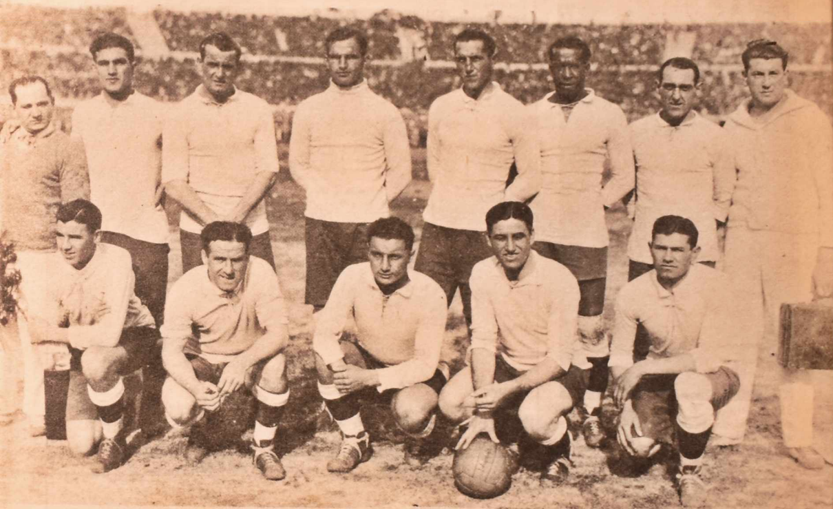
El primer Campeón del Mundo: Uruguay en 1930. En el Estadio Centenario de Montevideo, la generación que había ganado en Europa los dos últimos títulos olímpicos, obtuvo también el primer campeonato mundial.

Uruguay constituye una excepción en el fútbol del mundo. Posee títulos como ninguno, pero tiene aún el mérito mayor de que su alto nivel haya salido de un núcleo reducido, debido a la escasez de su población. En la historia de los Campeonatos del Mundo, ocupa un lugar preferente.