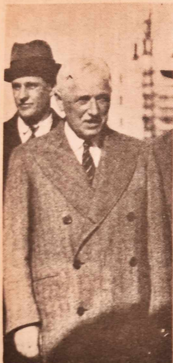
Jules Rimet, francés, por muchos años Presidente de la FIFA. Una vida al servicio del fútbol. Pisa el puerto de Montevideo en 1930.