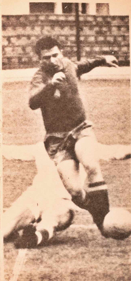
Ferenc Puskas, el artillero húngaro. Figura descolante de su equipo y del torneo de Suiza.

El sistema de disputa no era lógico. Se formaron cuatro grupos y cada país jugaba sólo dos partidos. Uruguay, por ejemplo, debió cumplir tres y sólo dos fueron sus actuaciones correspondientes a los octavos de final. Venció 2-0 (Míguez y Schiaffino) a Checoslovaquia y 7-0 a Escocia (3 Borges, 2 Míguez, 2 Abbadie). Se clasificó junto con Austria, que derrotó a Escocia 1-0 y a Checoslovaquia 5-0.