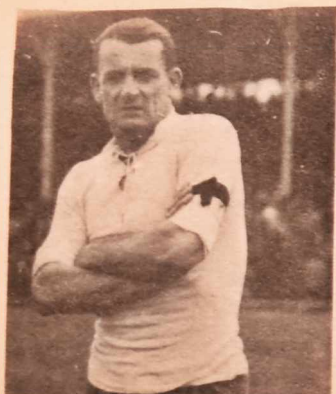
Nasazzi: capitán y líder de la generación más laureada del fútbol celeste.

Bélgica 1-0 con Paraguay; Rumania 4-0 contra Uruguay; y Francia 1-0 las dos veces, ante Argentina y Chile. Estas derrotas dan la pauta de un plano regular por parte de los europeos que, naturalmente, obtuvieron algunas victorias. Yugoslavia fue el mejor, siendo eliminado por Uruguay.