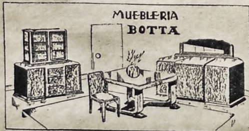
Elegante comedor lustrado en distintos tonos