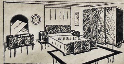
Soberbio dormitorio en abedul macizo, ceración de nuestros talleres