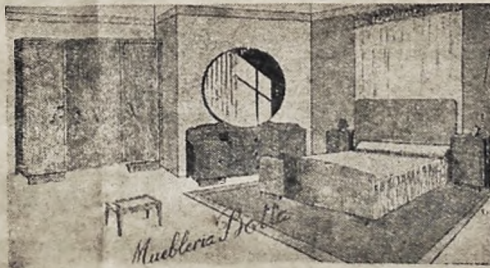
Regio dormitorio en abedul macizo

Para reparaciones de radio contamos con un personal de técnicos competentes