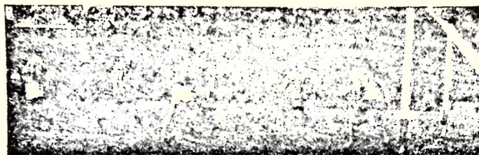
Machado shotea y primer empate del Sp. Sauce.