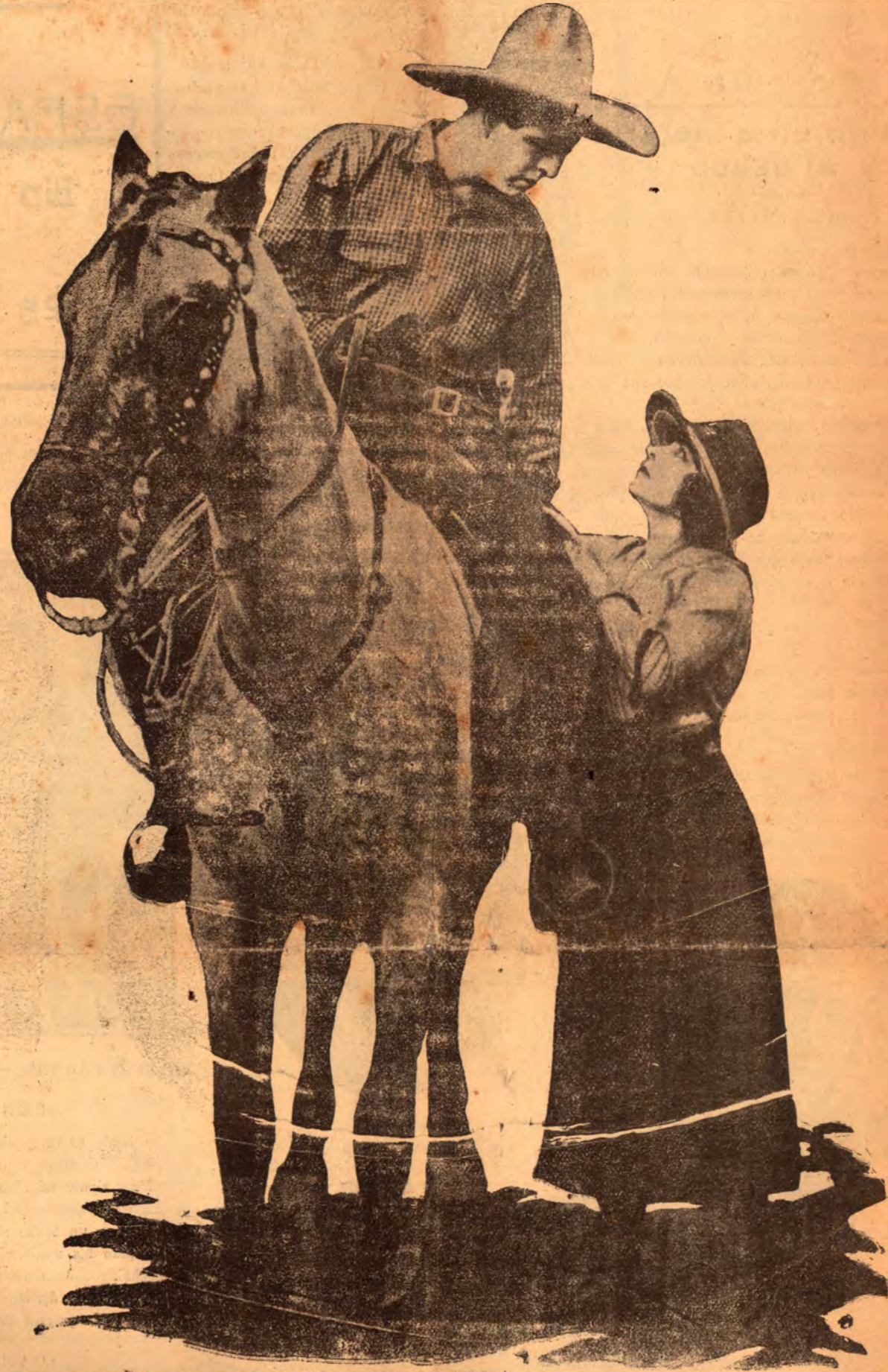
Jack Hoxie y Andlé Tourner en una sugerente pose del film «El Comisario de mano muerta» del «Bijou Progrma»

"La Quiebra" se va a... estrenar dentro de