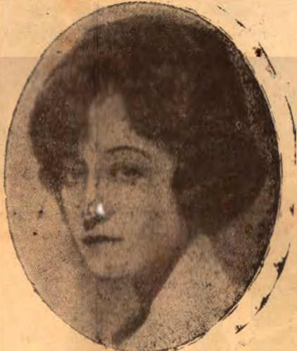
PAULINA FREDERICK, una buena actriz dramática

Amor, fuerza invisible que empuja el carro de nuestra existencia. Petróleo que alimenta de continuo la llamarada de luz que deberá alumbrarnos todos los caminos de nuestra vida.