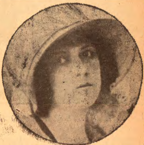
VIOLA DANA, popular actriz del cine