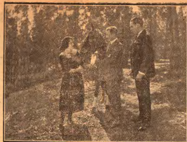
Una escena de Casco Sonoros

Hijo del famoso trágico, Ermete Novelli en la película dramática «La casa de vidrio»