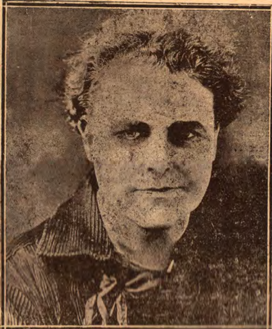
WILLI N FARNUN, el Zacon de la escena muda