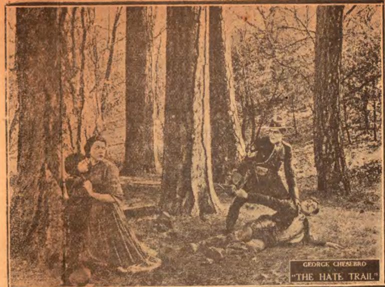
Momento emocionante del film El Sendero del odio