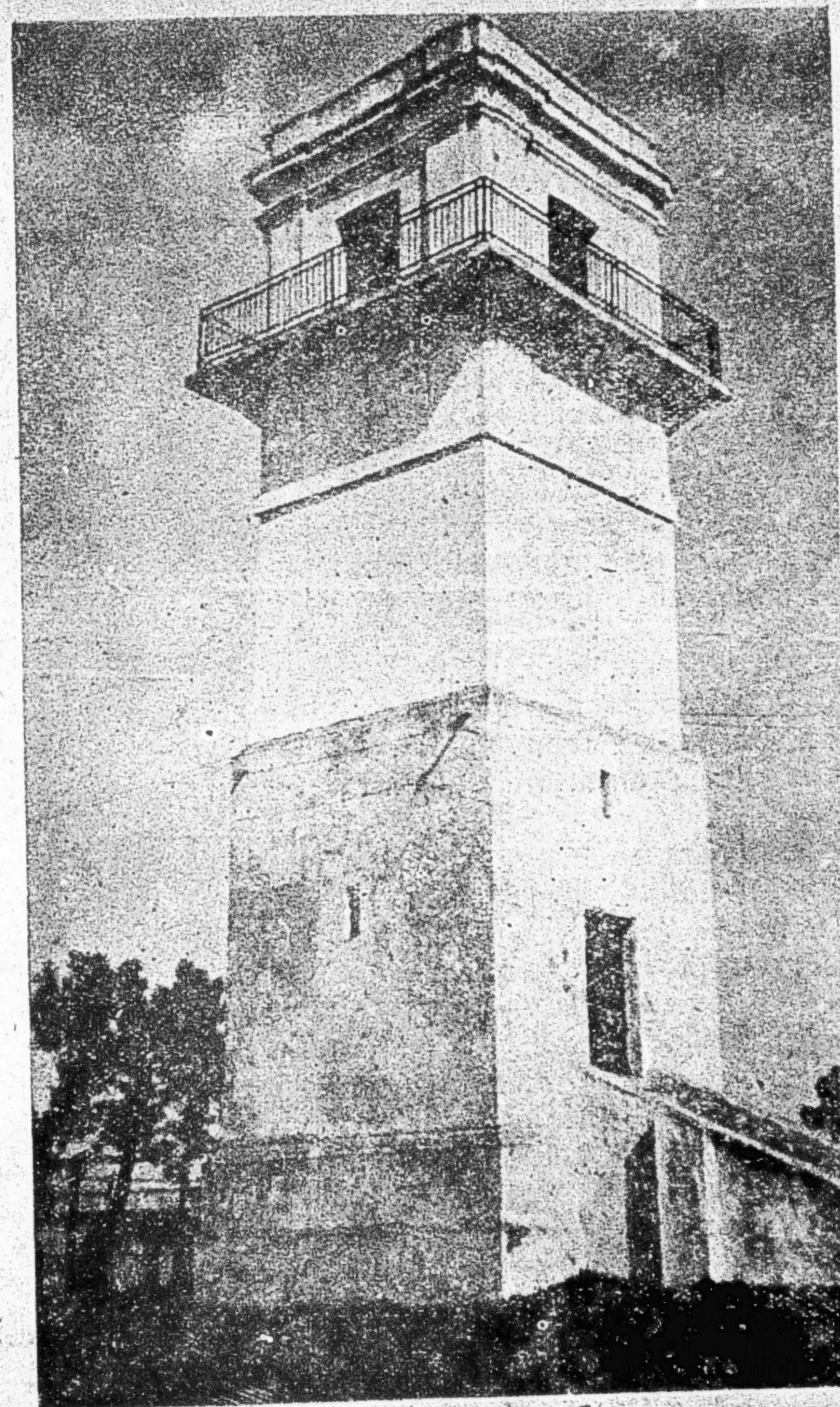
TORRE del VIGIA

Yo he buscado esa página de historia Que registre ese instante de mi vida Vanamente... ¡No existe en mi memoria!