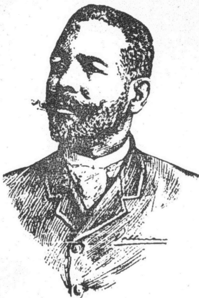
ANTONIO MACEO 1845-1896