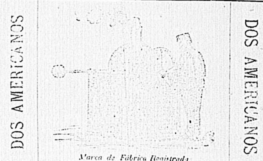
Marca de Fábrica Registrada

El café está acondicionado en tarros de medio, uno, dos y cinco kilos. El comprador puede llevarlo tostado, en grano ó molido. —En las ventas por mayor hacemos un descuento conveniente.