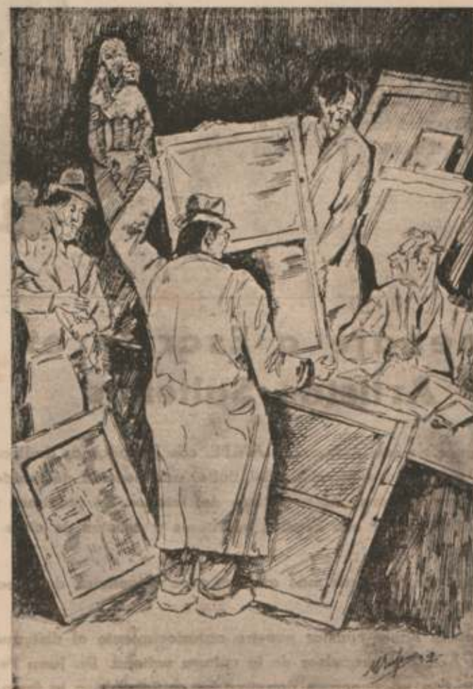
EL ENVIO AL SALON