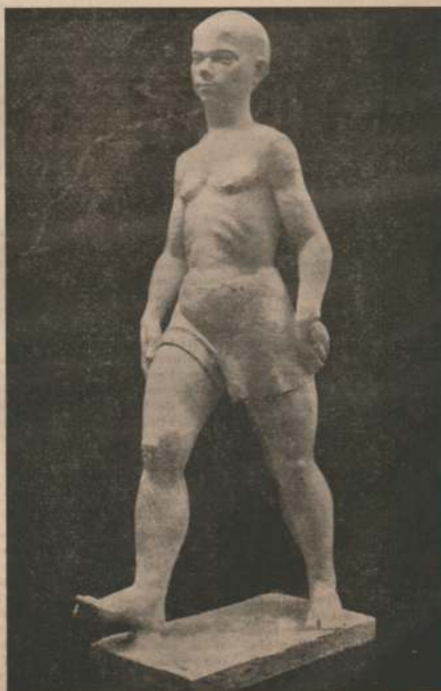
JOVEN EN MARCHA