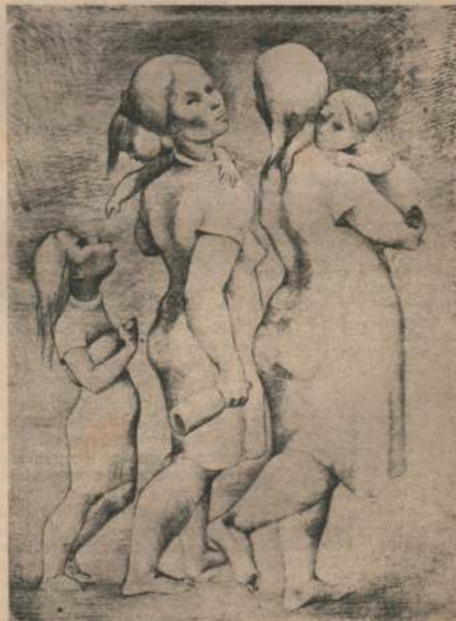
EN BUSCA DE KEROSÉN