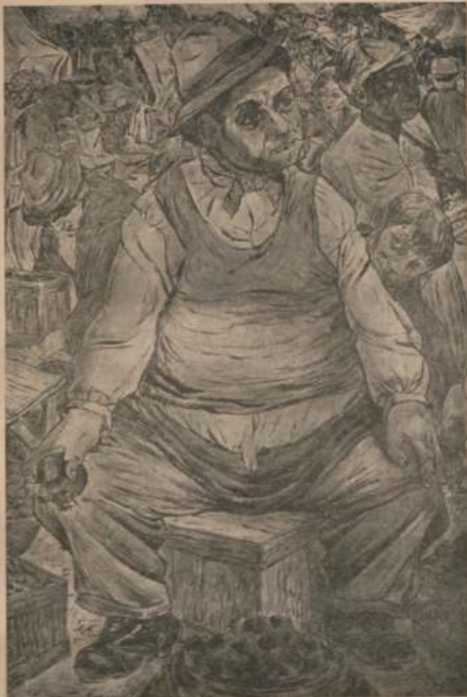
"EN LA FERIA"