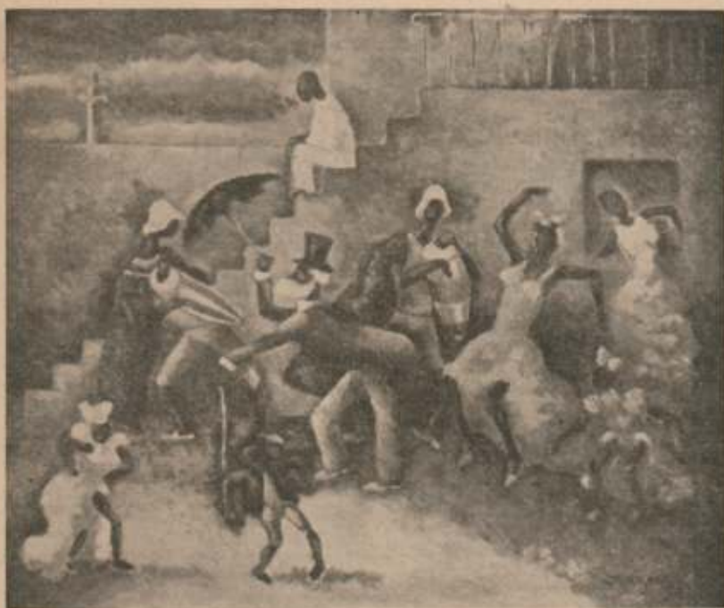
CARNIVAL DE LOS NEGROS