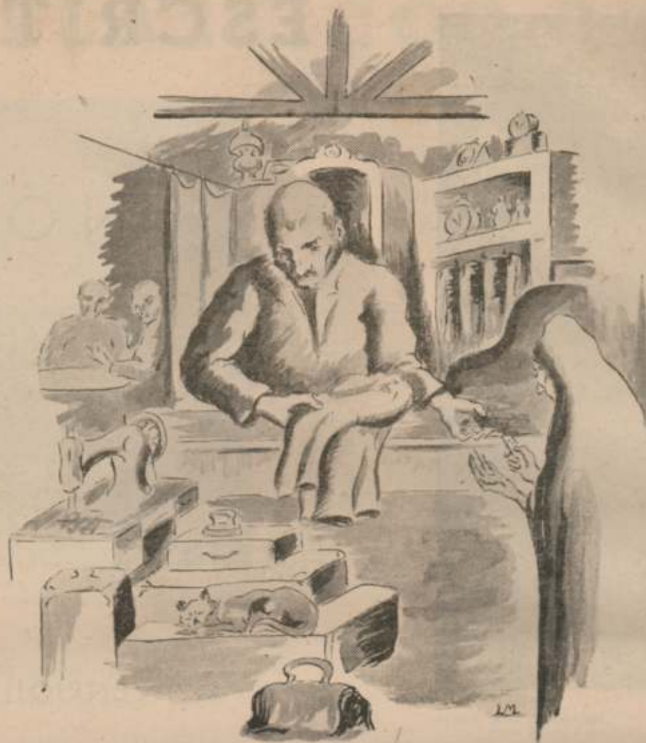
Ilustración de LUIS MAZZEI